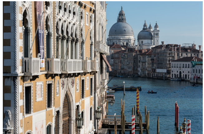
Rolf Zöllig © 2015

Zürich, Basel, Winterthur im Januar 2024